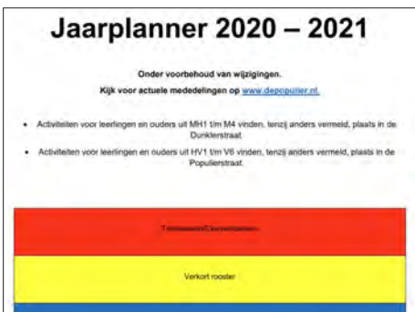
Jaarplanner: voor betrouwbare en up-to-date informatie over onze activiteiten