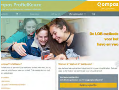
Online leermethode voor de profielkeuze voor havo/vwo leerlingen