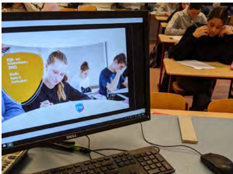
SE-week 2, kijk- en luistertoets

We merken dat de leerlingen het onderling niet zo nauw nemen met de afstand. Begrijpelijk maar heel onverstandig. Ik hoop dat u dat ook nog even met uw kind kunt bespreken.