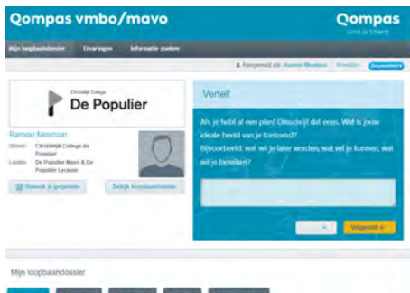
Online leermethode voor de profielkeuze voor mavo leerlingen