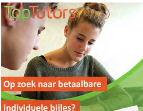
Betaalbare bijles van TopTutors