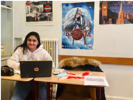
Leerlingen krijgen hulp tijdens de XL-uren