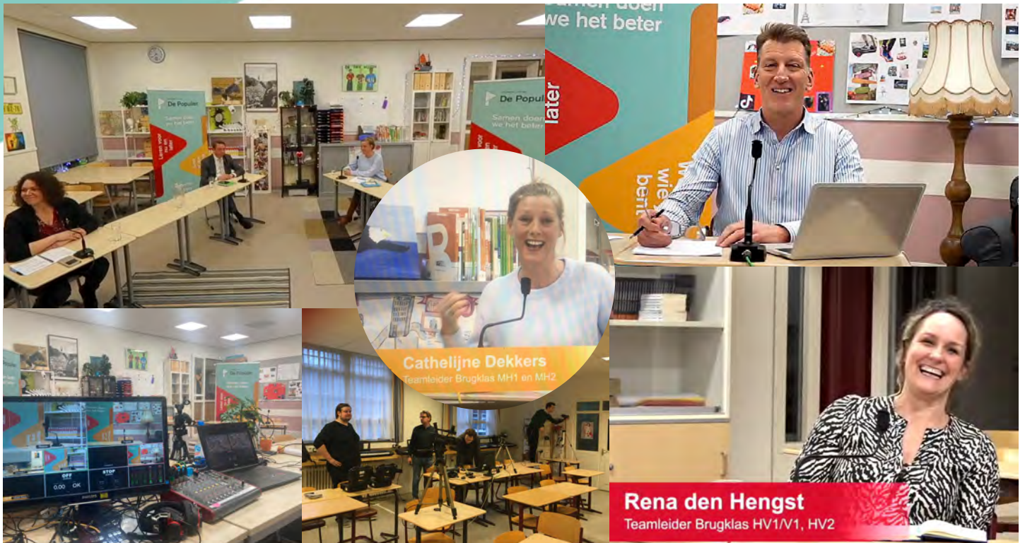
Digitale voorlichtingsavonden op 19 en 20 januari