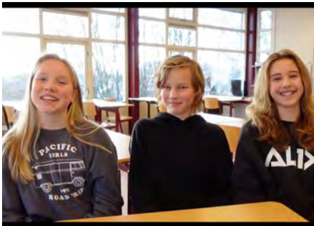
Voorlichtingsfilmpje 'Bruggers vertellen'