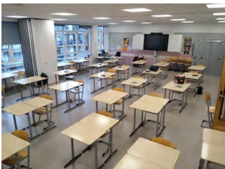
Anderhalve meter opstelling in de lokalen