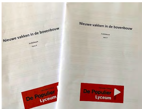
Leermethode voor de profielkeuze in HV3