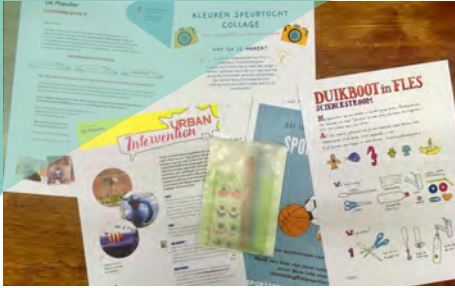
In plaats van een lesmiddag voor groep 8 dit jaar een verrassend lespakket.