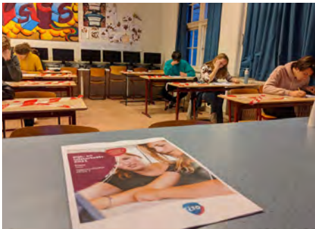
SE-week 2, kijk- en luistertoets

vanouds zijn. Dan is het toch fijn dat we de achterstanden hebben ingelopen, zodat leerlingen met voldoende bagage het eindexamen kunnen maken. Achter de schermen hadden en hebben we hiervoor een heel 'Deltaplan', maar dit plan kan pas in werking worden gesteld als de leerlingen ook daadwerkelijk weer op school komen. Op dit moment zijn we al bezig om zoveel mogelijk leerlingen naar school te halen als ze gebaat zijn bij toezicht en hulp om aan te kunnen blijven haken bij hun klasgenoten. Ook is er extra aandacht voor het zogenaamde 'leren leren'. Leerlingen die hierbij wat extra hulp kunnen gebruiken, krijgen speciale cursussen op school om ze in de leermodus te zetten en het leren zo goed mogelijk te laten verlopen. Weten hoe je iets moet leren is namelijk geen vanzelfsprekendheid. Dit vereist begeleiding.