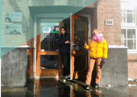
Leerlingen uit de voor-examen klassen maken de toetsen op school