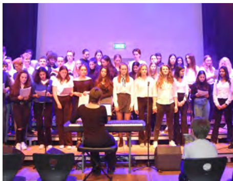
Podium Bovenbouw 2020