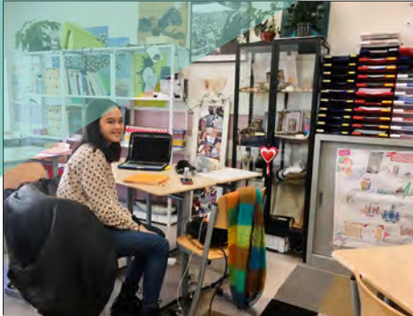
Leerlingen krijgen hulp tijdens de XL-uren

vanouds zijn. Dan is het toch fijn dat we de achterstanden hebben ingelopen, zodat leerlingen met voldoende bagage het eindexamen kunnen maken. Achter de schermen hadden en hebben we hiervoor een heel 'Deltaplan', maar dit plan kan pas in werking worden gesteld als de leerlingen ook daadwerkelijk weer op school komen. Op dit moment zijn we al bezig om zoveel mogelijk leerlingen naar school te halen als ze gebaat zijn bij toezicht en hulp om aan te kunnen blijven haken bij hun klasgenoten. Ook is er extra aandacht voor het zogenaamde 'leren leren'. Leerlingen die hierbij wat extra hulp kunnen gebruiken, krijgen speciale cursussen op school om ze in de leermodus te zetten en het leren zo goed mogelijk te laten verlopen. Weten hoe je iets moet leren is namelijk geen vanzelfsprekendheid. Dit vereist begeleiding.